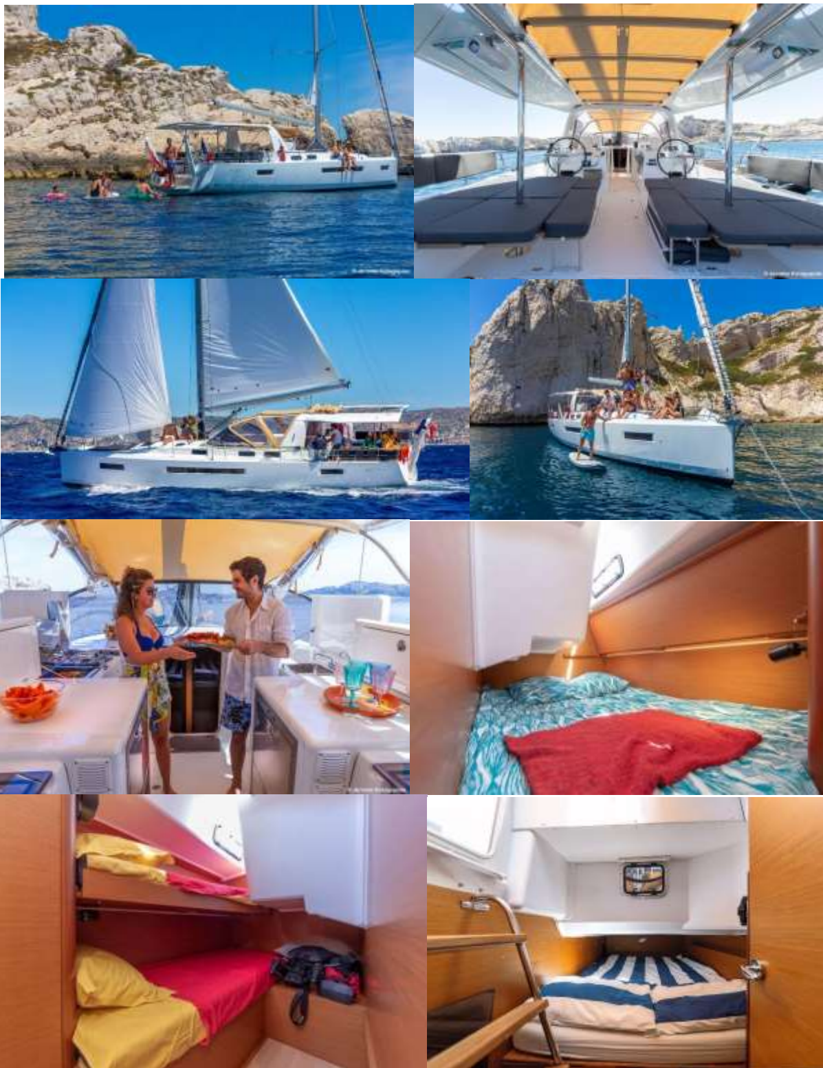
Beispielfotos des beschriebenen Yachttyps